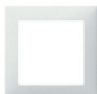
Blanc mat 800.305.083SM