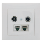
Exemples ABB Sidus®-compatible de ZidaTech