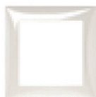
Blanc brillant 800.305.073SW

Pour créer une prise design avec le design ABB Sidus® , il faut sélectionner un article de la configuration MAP* et le cadre souhaité . Les coloris MAP sont définis selon les codes de design et de coloris spécifiés ci-dessous. Les deux cadres illustrés sont disponibles chez ZidaTech. D'autres cadres sont disponibles dans le commerce.