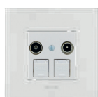
Exemple Legrand® Arteor™-compatible de ZidaTech

* Toutes les prises de la configuration MAP peuvent être coordonnées avec les cadres Arteor™ en taille 1